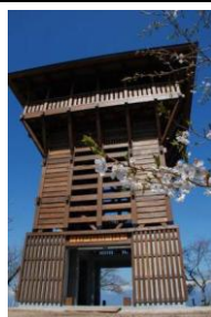
長峰山山頂展望台