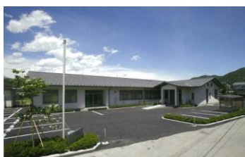
明科社会就労センター