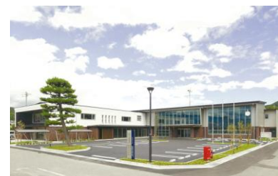
明科支所・明科公民館複合施設