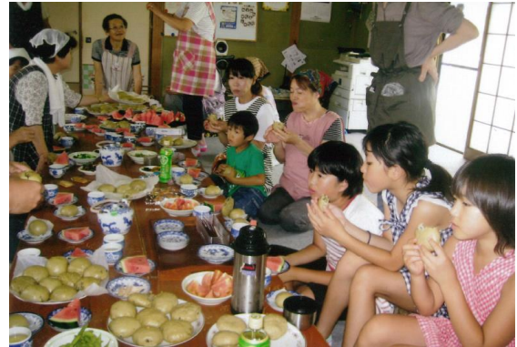
まんじゅう会と交流