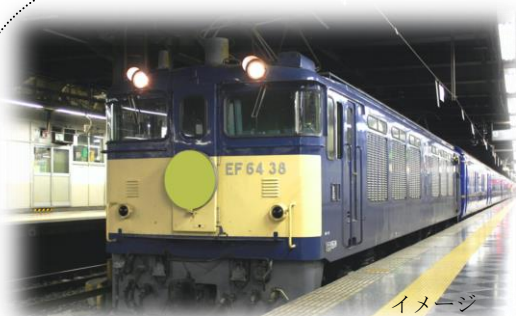
EF-64 ブルートレイン信州