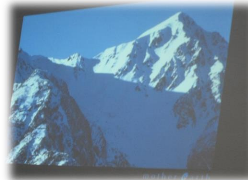
DVD「美しい日本の風景」を鑑賞