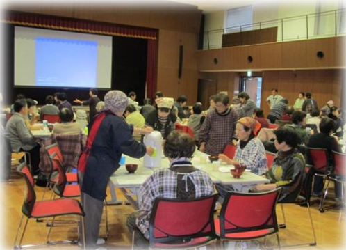
お茶を頂きながら各テーブルで懇談