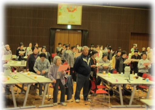
「わが町明科」を全員で合唱