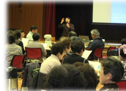
宮下さんの指揮で紅葉・故郷の空・野菊・旅愁の4曲を合唱