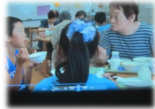
健康への意識を持ち、よく遊び、よく動き、よく食べる、正しい知識で老化を防ぐ