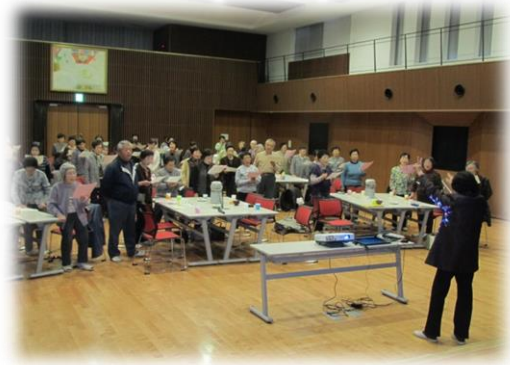
参加者全員で「わが町明科」を合唱