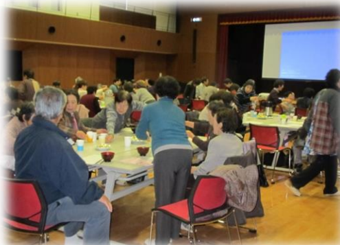
かぼちゃ団子でお茶を頂きながら談笑