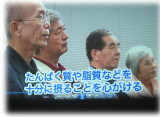
DVD「高齢期は食べ盛り」を鑑賞