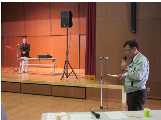
安井公民館長から奏者紹介