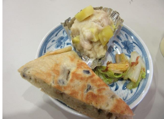
おもてなし隊の皆さんによる薄焼きおやきと相模原のおやき