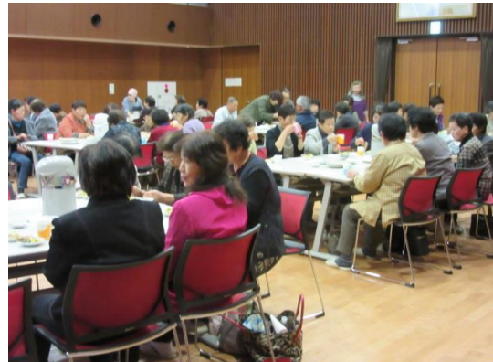
お茶を頂きながら夫々団樂の一時を