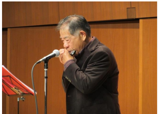
演歌 安曇野・北国の春・川・山・ああ上野駅の5曲を巧みなトークを交えながら演奏(オクターブハーモニカ使用)