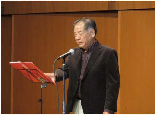
宮下さんより挨拶