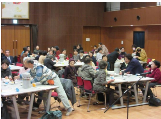
お茶を飲みながら歓談