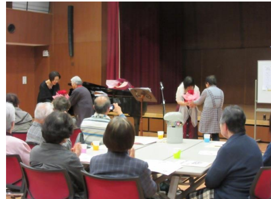
花と記念品を贈呈