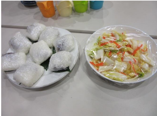
お茶受けは道明寺と野菜の朝漬け