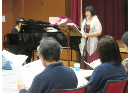
全員でわが町を合唱