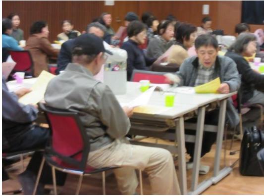
二部 皆と一緒に歌いましょう ・もみじ・かあさんの歌・里の秋・ふるさとの4曲