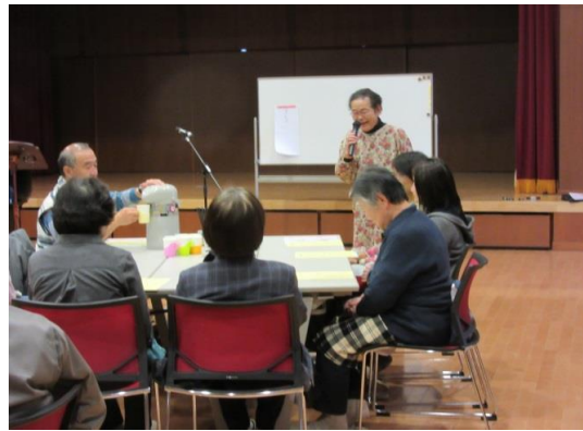
宮川副代表からお茶受けについて