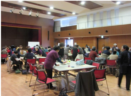
お茶を飲みながら歓談