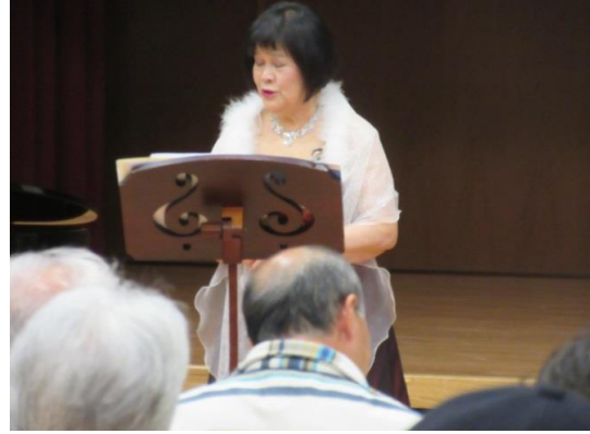
この道・かやの木山・中国地方の子守歌・かねが鳴ります 歌う前に作詞者の時代背景、詩の内容など説明