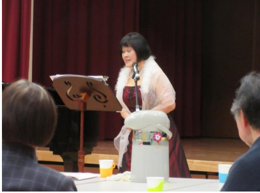
アンコール曲として よかつたを熱唱