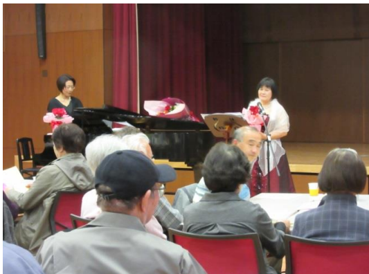
安井公民館長よりお礼の言葉