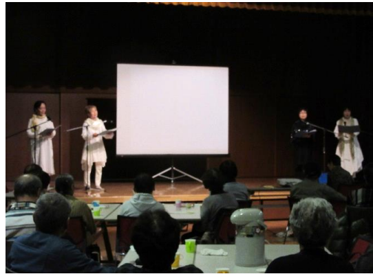
群読 水仙月の四日