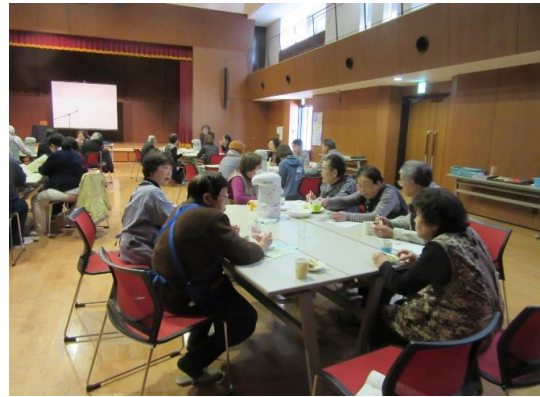
お茶をいただきながら歓談