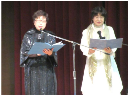
群読 水仙月の四日