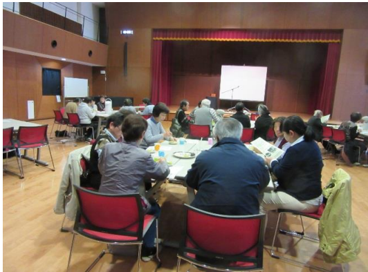
お茶をいただきながら歓談