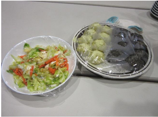
今回のお茶うけは、牡丹餅と野菜の浅漬け