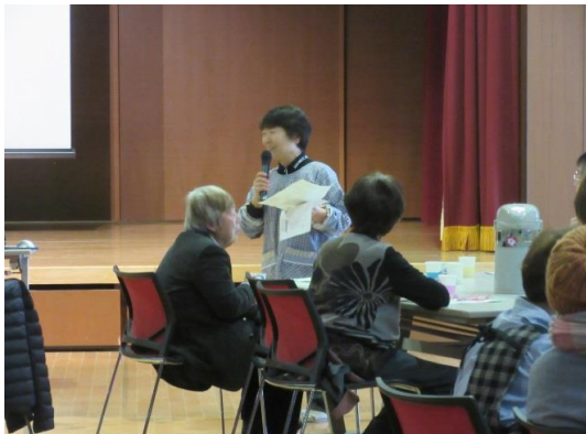
浅見さんから出演者紹介