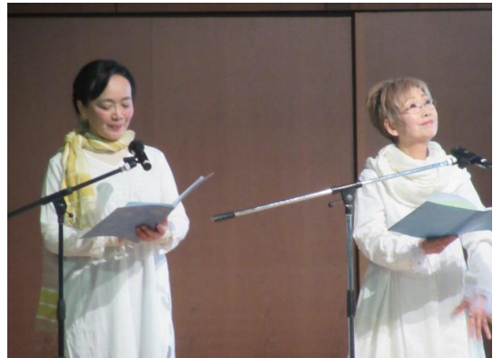
森のおうちお話の会のみなさん