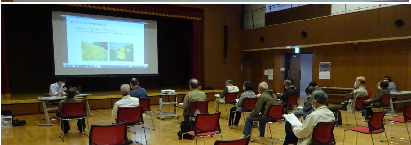
説明に聞き入る参加者