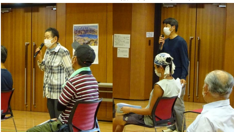
意見を述べる参加者