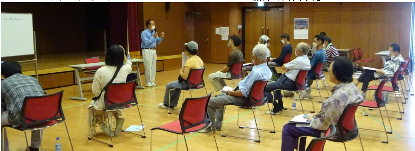
話に聞き入る参加者