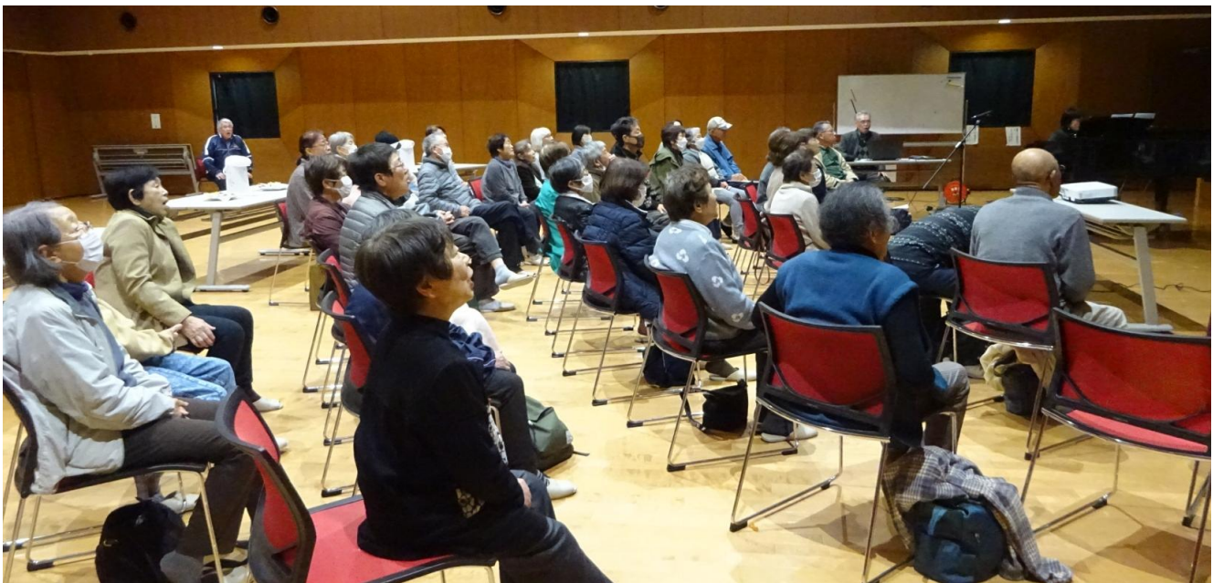
発声練習をする参加者